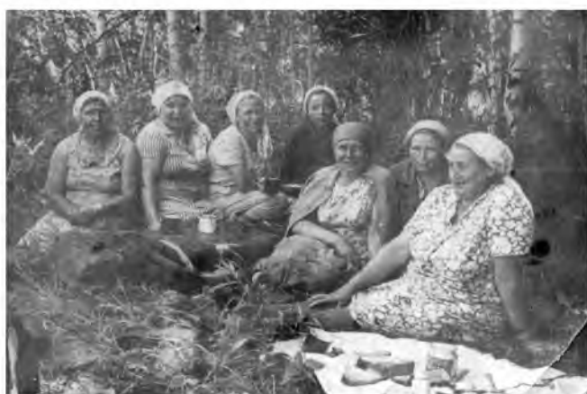
Обеденный перерыв в период сенокоса