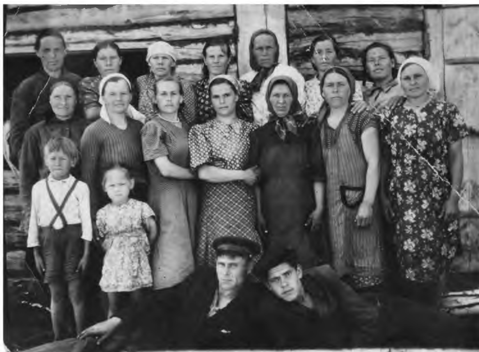
Рабочие овцефермы д. Лешаково Бригада № 3, 1955 г.