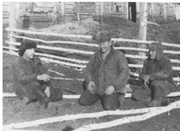
Работники животноводческой фермы