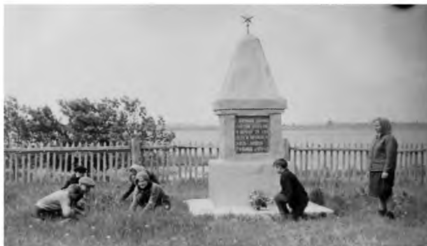
Памятник погибшим воинам в д. Карасёво был открыт в 1965 году