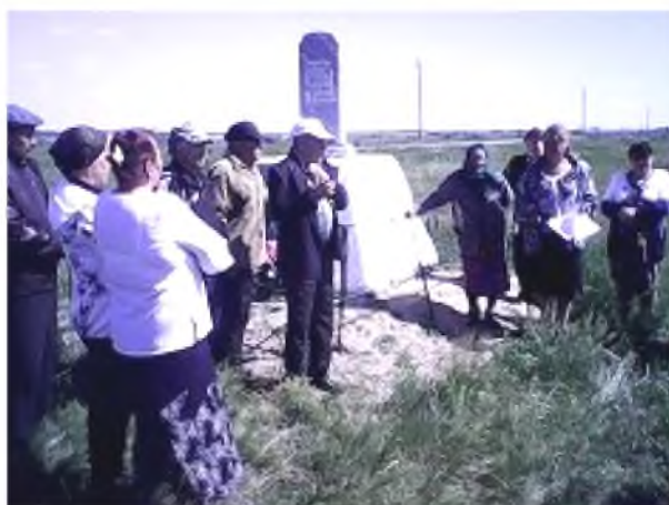
Встреча бывших жителей д. Лешаково, 2014 г.