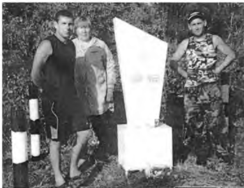
Установка памятника в деревне Ворошилова