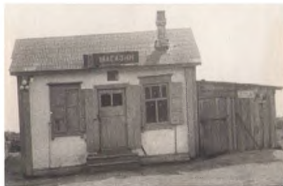
Магазин д. Карасёво

Карасёвская бригада входила в состав колхоза «Родина», с 1000 га пахотной земли, которую обрабатывали 9 тракторов и 4 комбайна. Коров на ферме – 200 голов, каждая из которых в среднем давала по 8 л молока. В бригаде было 70 человек. На ферме работало 5 доярок. Механизаторов было 15 человек.