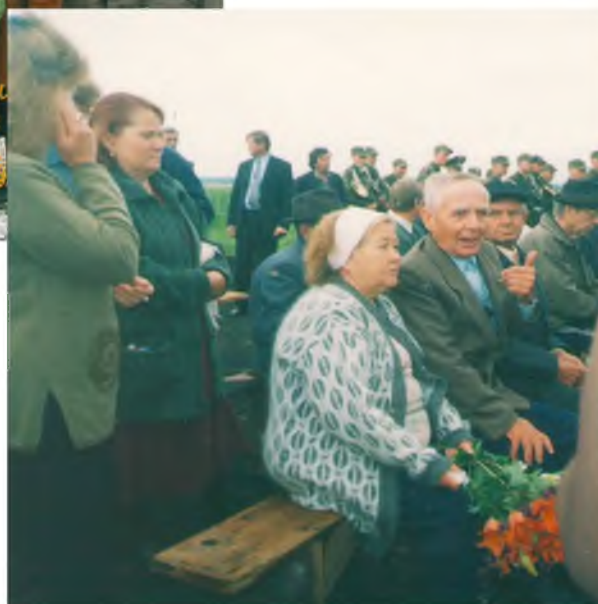
Открытие памятника деревне Малое Жужгово (6.06.2003 г.)