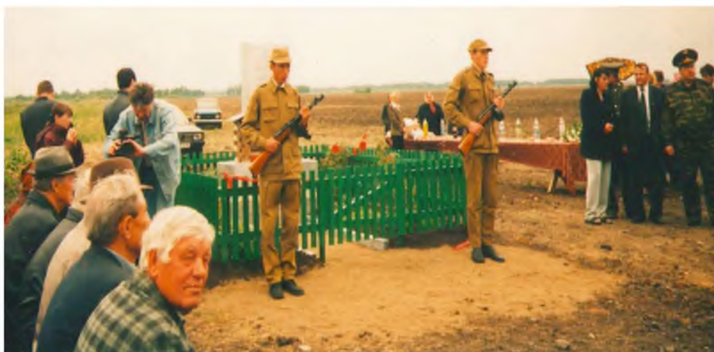
Открытие памятника деревням Октябрьёвке, Крестовке, Якшино, Чипренёвке, Угловое Рижского сельсовета