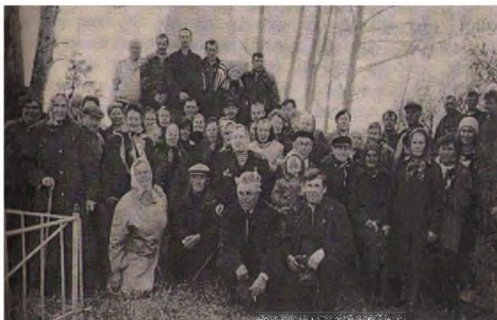
Встреча односельчан на кладбище Д. Большое Жужгово 9 мая 2003 года