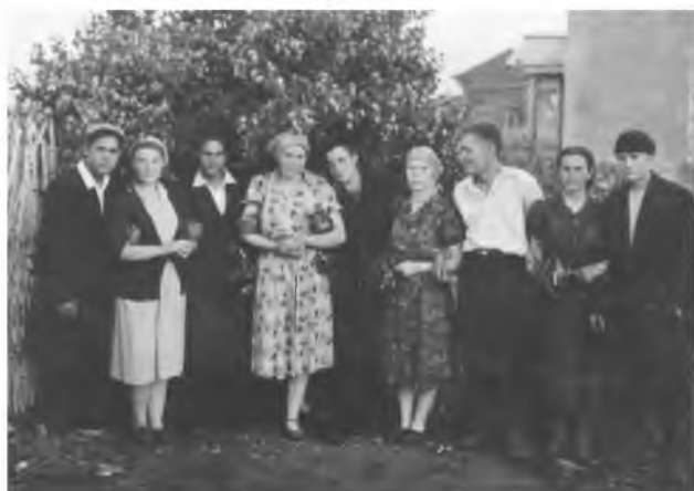
Молодёжь у сельского клуба (1)